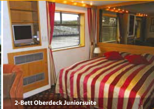
2-Bett Oberdeck Juniorsuite