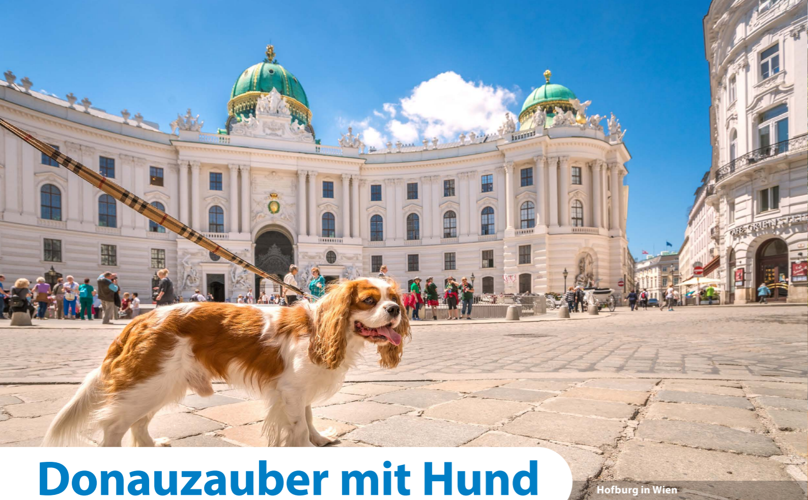
Hofburg in Wien