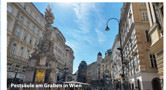
Pestsäule am Graben in Wien