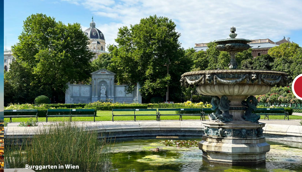
Burggarten in Wien