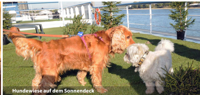
Hundewiese auf dem Sonnendeck