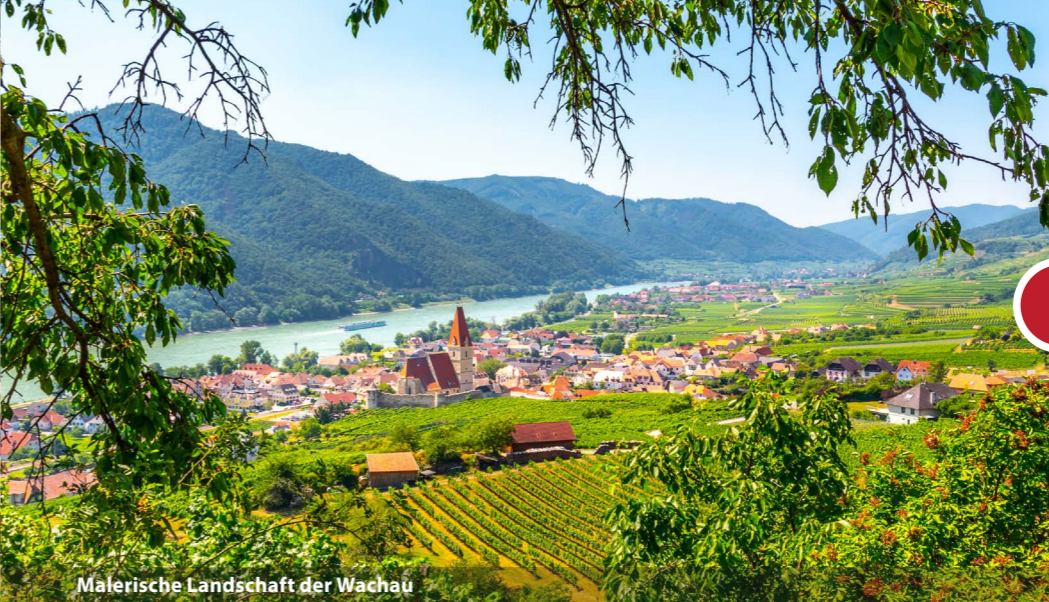
Malerische Landschaft der Wachau